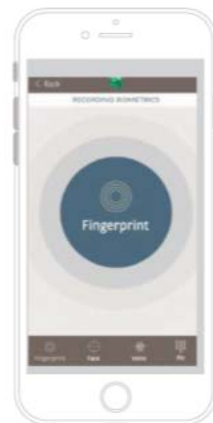
Touch To Approve (Fingerprint ID)