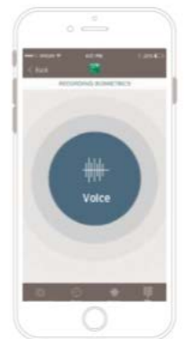
Your Voice Is Your Password (Voice recognition)