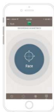
Snap A Selfie (Facial Recognition)